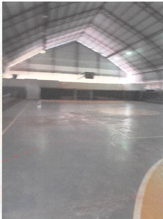
Ginásio de Esportes – Jardim América