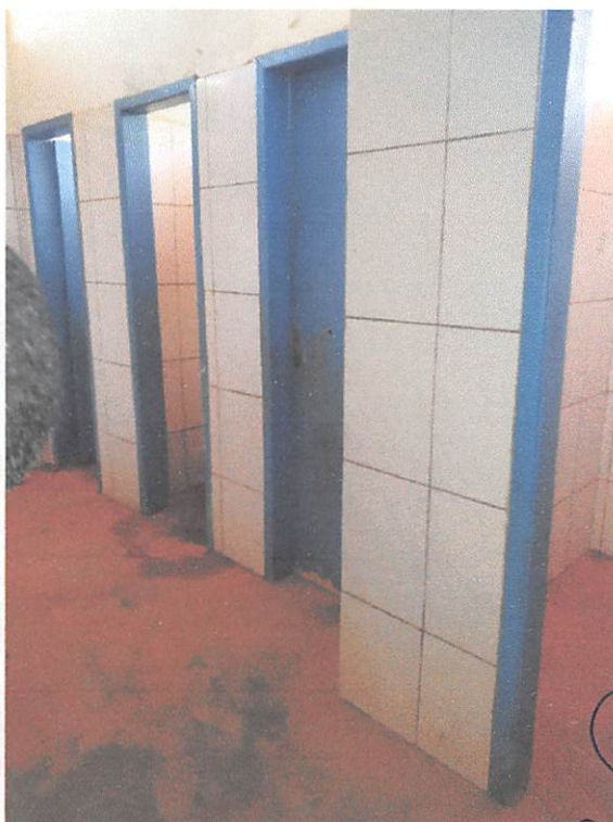
Ginásio de Esportes – Jardim América