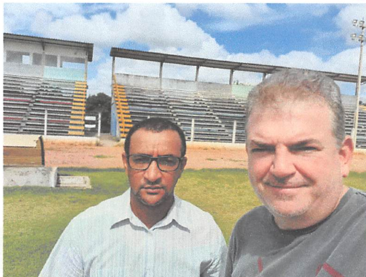
Estádio Municipal Danilo Pagot

Face ao exposto, solicito a Vossa Excelência a realização de serviços de manutenção, como pintura, capinação, reparos em janelas, paredes e portas, substituição de bebedouros, entre outras providências que o caso requer, objetivando conservar as edificações e fomentar a prática esportiva no município.