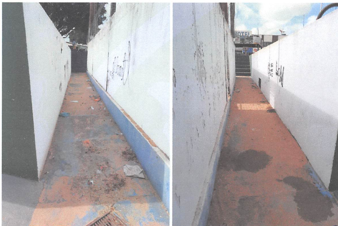
Quadra de Areia – Praça dos Colonizadores