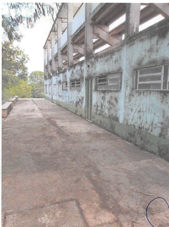
Estádio Municipal Danilo Pagot