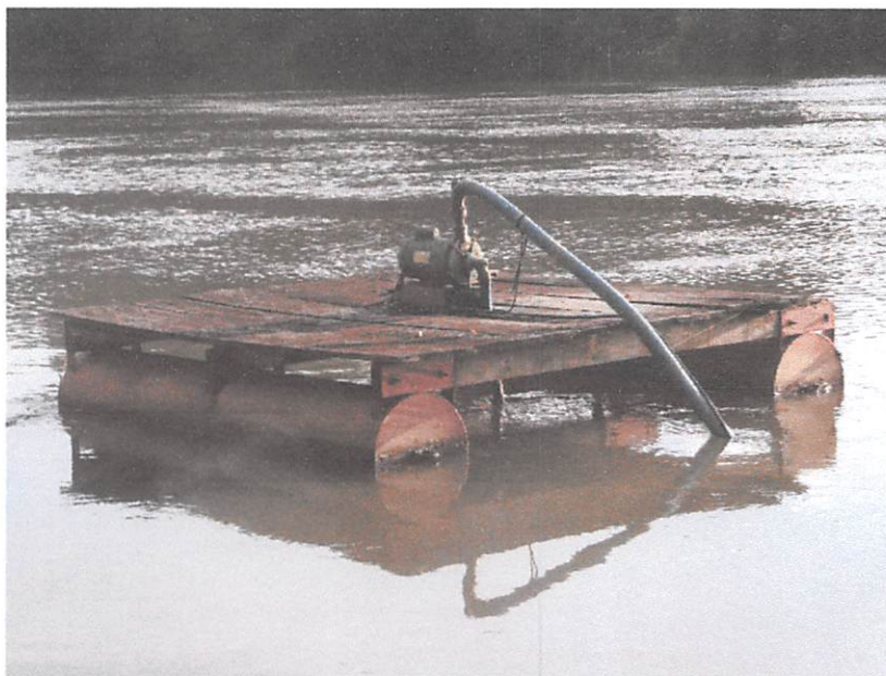
Fig. 03

Desde de a implantação do sistema de captação de água do Rio dos Peixes, (Fig. 03) não houve nenhuma iniciativa consistente da parte da SESAI, que pudesse resolver a questão de tratamento de água na Aldeia Nova Munduruku.