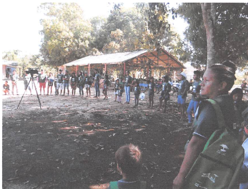
Fig. 04

A proposta buscava abordar, a situação do sistema de tratamento da água na Aldeia, elaborando assim um plano de intervenção junto aos seus moradores, com propostas de ações que pudesse diminuir as problemáticas causadas pela falta de tratamento e saneamento básico e suas vertentes.