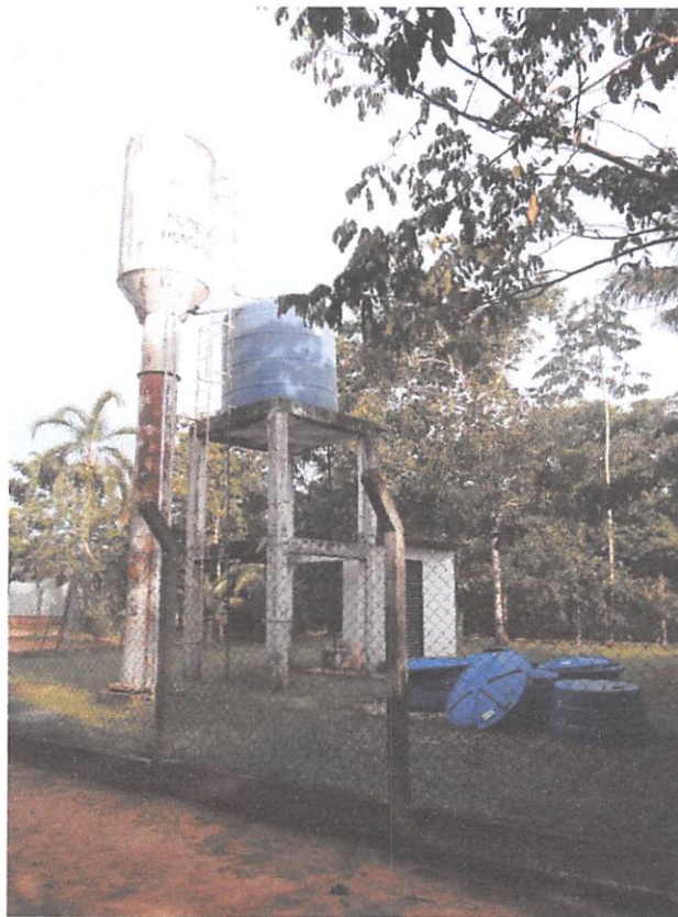
Fig. 02

Este sistema de abastecimento, foi implantado em 2006, ano em que a Saúde Indígena passou a ser administrada pela FUNASA 8 , e que muito contribuiu na facilitação no abastecimento nas casas, a mesma é composta de uma caixa d'água, (Fig.02) distribuídas por torneiras espalhada por toda a Aldeia, a água de início era captada de um poço, com o uso de uma bomba elétrica, vindo de uma placa solar, e que não demorou muito para apresentar problemas, que logo foi substituída com a chegada de energia, por outra que captava água direta do Rio dos Peixes.