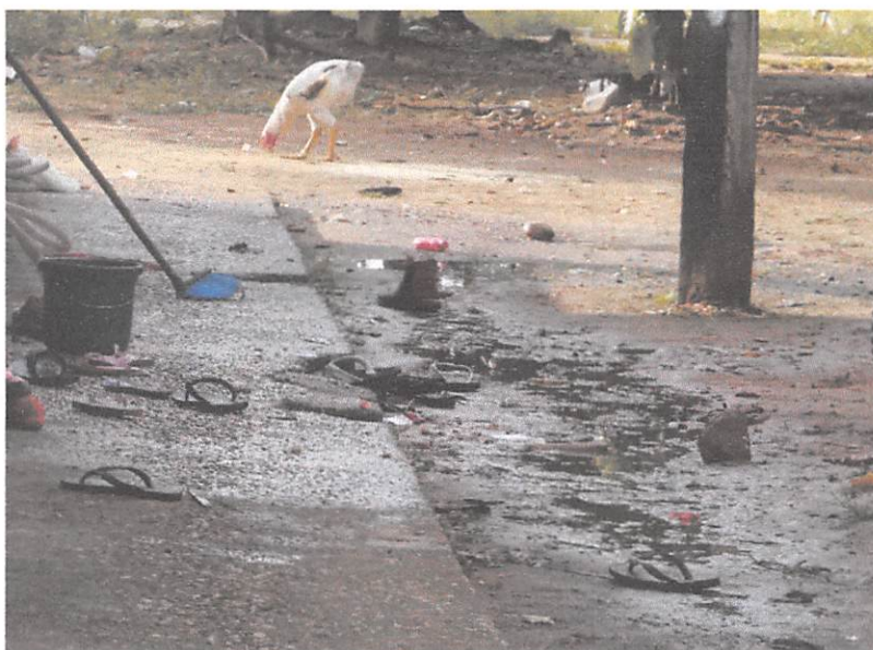
Fig. 01

Também fica comprometida o consumo, pois não há filtro em todas as torneiras das residências, e conseqüentemente vem tendo aumento da incidência de diarreia, e seus sintomas, que se estende para os animais domésticos, como as galinhas, cachorro, gatos, que passa a ser portadores de patologias nociva a saúde dos moradores da Aldeia Nova Munduruku.