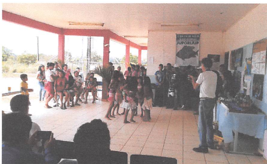
Fig. 05

O projeto Poço de Carbono Juruena, e seus parceiros Estadual Indígena “Krixixi Barompô”, e outros, realizou em agosto de 2018, um seminário de apresentação das propostas de intervenção, de educação Ambiental, na Escola Estadual de Indígena de Educação Básica Juporijup, Aldeia Tatuí do Povo Kayabi,