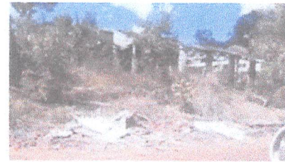
Barracão virou entulho.

A referência é para a sede da Associação dos Moradores do Parque Kennedy, que depois de várias diretorias e muitos eventos sempre com bastante participação popular, hoje se encontra completamente destruída.