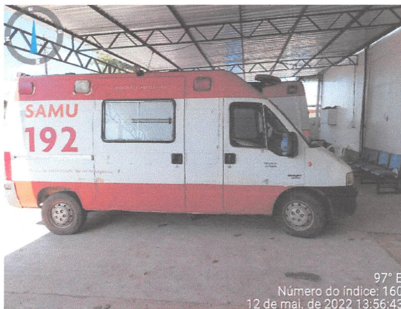
97° E Número do índice: 160 12 de mai. de 2022 13:56:43