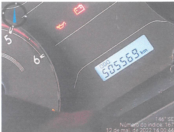
146° SE Número do índice: 167 12 de mai. de 2022 14:00:44