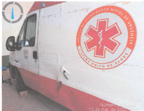
353° W Número do índice: 162 12 de mai. de 2022 16:57:02