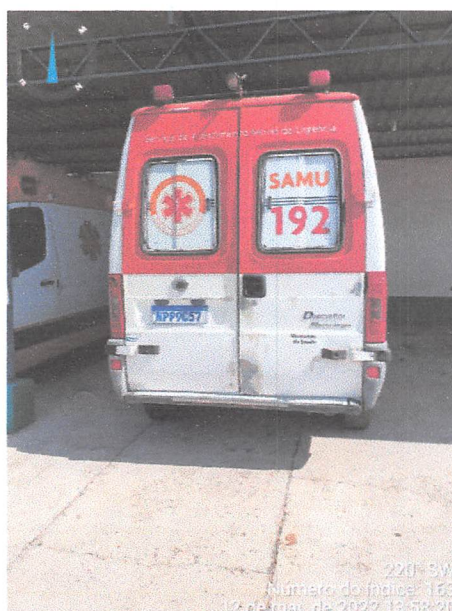
220° SW Número do índice: 163 12 de mai. de 2022 13:58:20