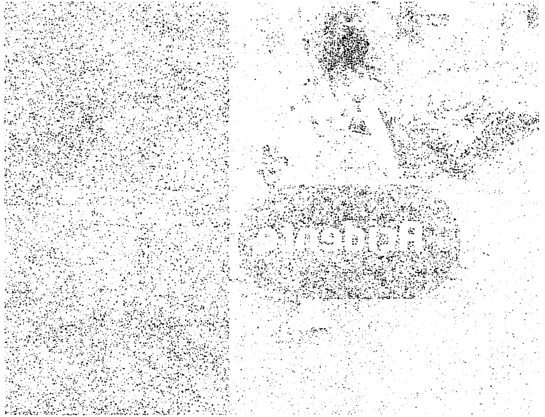
Uma criança sentada em uma caixa, segurando um livro.