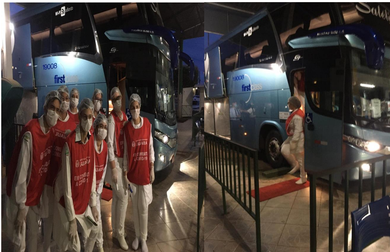
FOTOS 03,04,05 : Orientação e verificação de temperatura na Rodoviária