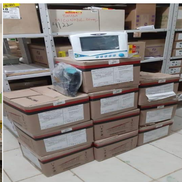
FOTO17: Aquisição de Equipamentos