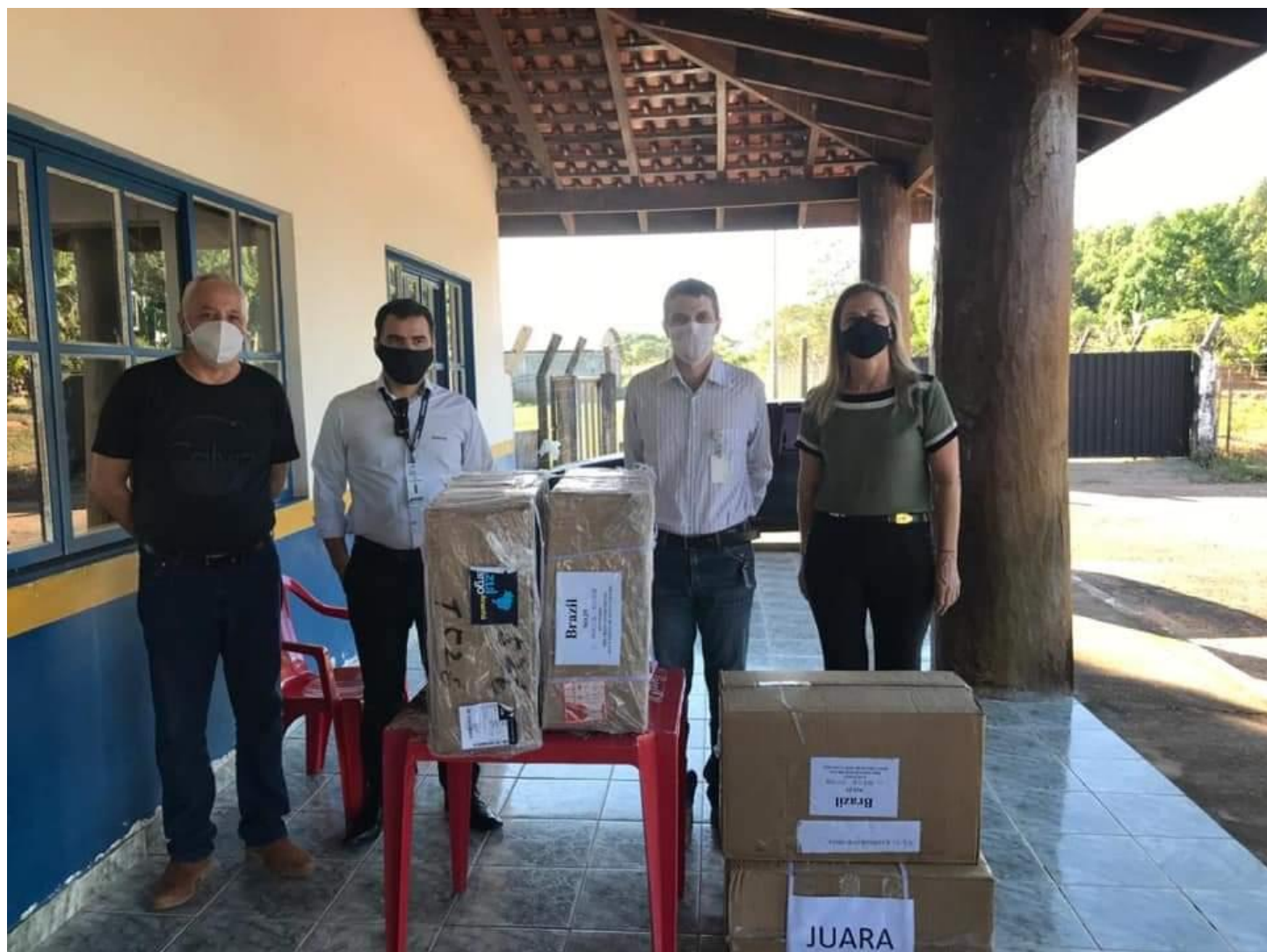
FOTO 18: Aquisição de Ventiladores – Parceria com iniciativa privada.