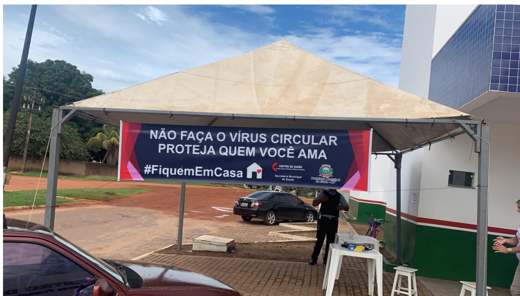
FOTO 10: Tendas nas Unidades de Saúdes – Para manter o distanciamento.